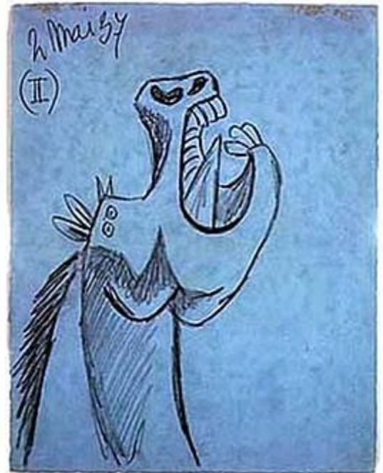
Pablo Picasso. Caballo, estudio preparatorio para el Guernica. Museo Reina Sofía.

Conocer los aspectos técnicos de tus materiales es importante para que consigas de ellos los mejores resultados.